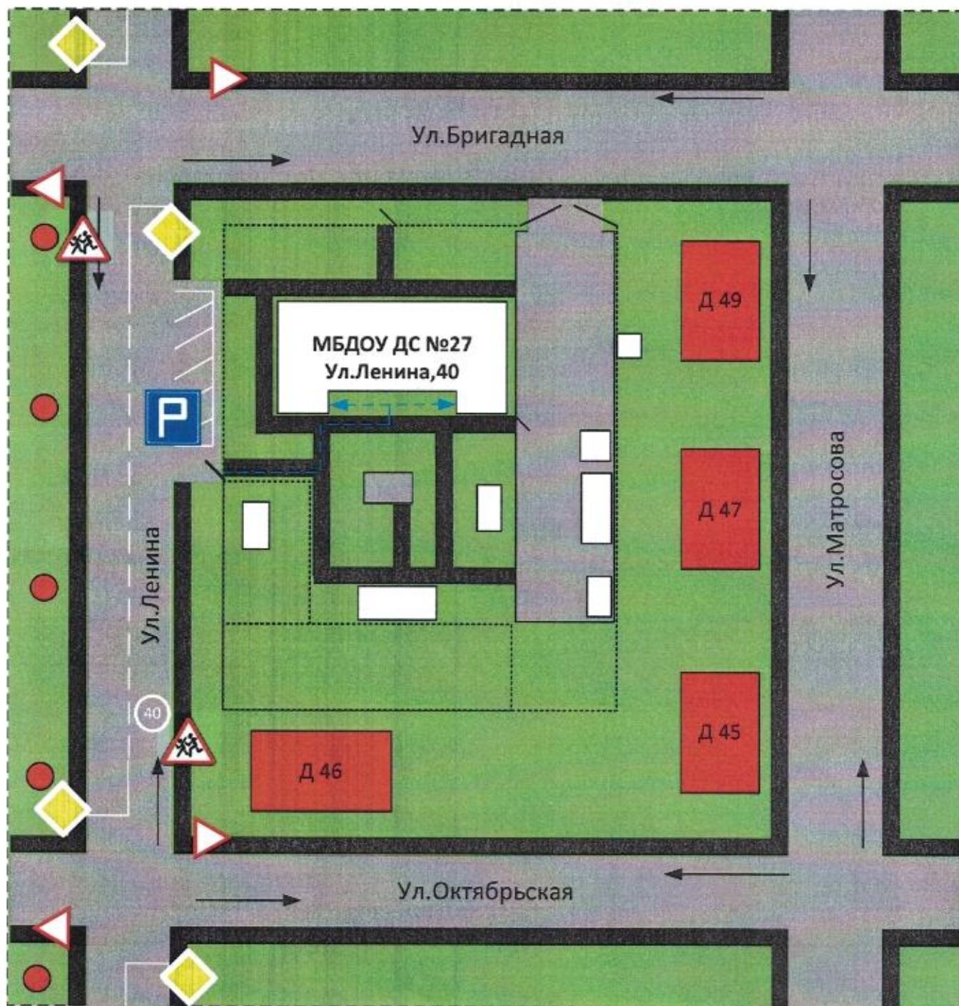
Схема организации дорожного движения в непосредственной близости от образовательного учреждения с размещением соответствующих технических средств, маршруты движения детей и расположение парковочных мест.

→ ← - направление движения транспортного потока